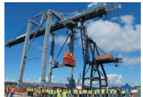
FØRSTE I EUROPA: Moss Havns nye gantrykran er levert av Kocks Krane i Tyskland.

Løftekapasiteten til den nye gantrykranen er 40 tonn og hastigheten er 30-35 containere i timen i følge Kocks i Tyskland. Kranen rekker 35 meter utover havnebassenget og 16 meter