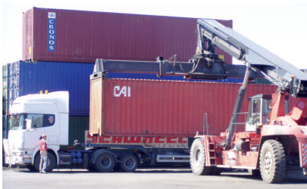
EN DRYPORT på Vestby kan gi etterlengtet bakareal for havnen i Moss.