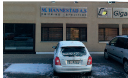
KONTORET: M. Hannestad AS holder til i Knivsoveien 4-6 i Halden, omtrent midt mellom E6 og sentrum.

Det siste oppkjøpet Andersen & Mørck gjorde var å kjøpe den nærliggende konkurrenten på Øra, Glommen Shipping AS, i 2005. Etter en stund valgte man å samlokalisere de ansatte.