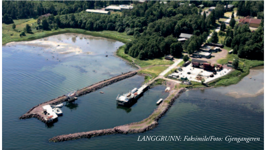
LANGGRUNN